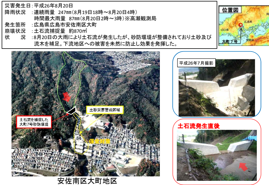
図-2 砂防施設の効果事例（広島市安佐南区大町）