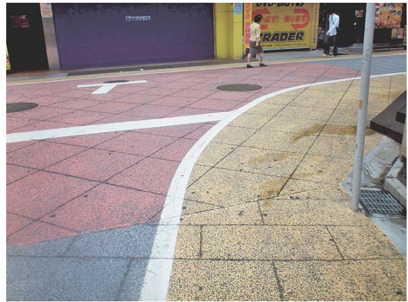
写真-10 整備状況(西新宿一丁目地区)

また、アンケートの際の住民からの意見を参考に、ワークショップ活動において整備方針を検討していく中で、歩車混在の道路を車道と歩道を色彩で区別し、歩行者の安全性を優先的に考えることにしました。その結果、舗装のカラー化によって景観向上を図り、地区全体の舗装を景観性に優れ、舗装性の機能を備えた環境にも優しい半たわみ性舗装を採用することにしました。また、半たわみ性舗装を加工し、石畳風の目地をアクセントにすることで、景観上の配慮も行うことで、まちなみをグレードアップさせ、交差点部は、安全性の向上と注意喚起のために、色やデザインを工夫しています(写真-9, 写真-10)。