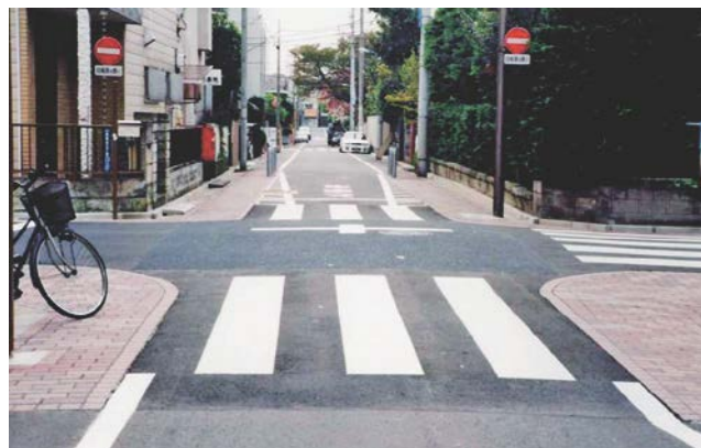
写真-6 西落合コミュニティゾーン形成事業 平成8年度～平成10年度

新宿区では、歩行者が安全に、かつ、安心して通行できるよう「人とくらしの道づくり事業」を進めており、平成8年度から3年間で西落合地区を、平成16年度から3年間で新宿一丁目地区をそれぞれ整備しました。