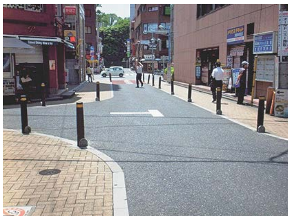
写真-7 人とくらしの道づくり事業（新宿一丁目地区） 平成16年度～平成19年度

次に、新宿一丁目地区は、東京メトロ新宿御苑駅が隣接する業務機能が集中している地区で、車両と歩行者が混在する地域です。事業では、車道部と歩道部との差別化を図るとともに、車道部は、環境に配慮した保水性舗装としています。また、歩道部を広げてインターロッキングブロック舗装とし、色彩の点でも差別化を図り、安全確保に努める工夫を行いました（写真-7）。