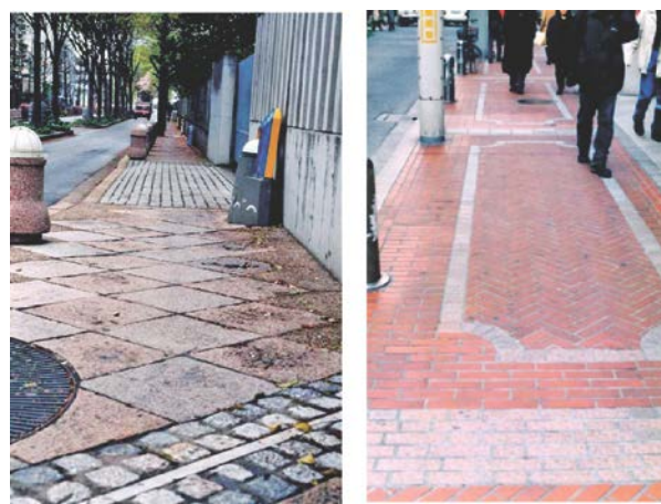
写真-2 歩道整備状況（昭和60年～平成4年頃）

者優先への価値観の転換が図られましたが、既成市街地における道路幅の物理的制約に応じて、歩行者の安全性確保への施策は個別対応で行われています。新宿区では、生活道路が大半の区道で、歩車分離を図ることが可能な路線を選定し、精力的に歩道設置事業が進められました。道路構造・形態の改良等のハード整備のほか、交通安全思想の普及・啓発などのソフト面からも安全・安心の歩行環境確保が進められています。一方、駅周辺の商店街では、景気対策の一環として、昭和50年代後半から賑わい交流空間を創造するために、道路景観の充実や歩行者を優先した石畳やタイル舗装化への意欲が高まり、関係機関との協議を重ね、表層をタイル舗装にして景観向上を図る自主的な整備がされています（写真-2）。