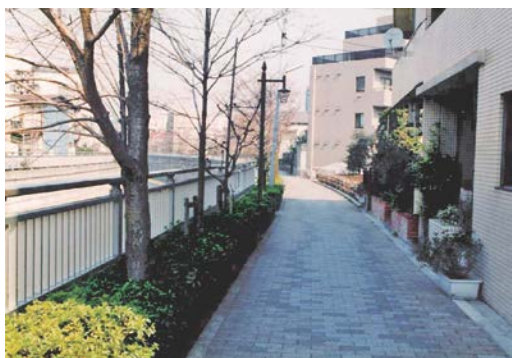
写真-3 河川沿いの道路（自転車歩行者専用道路）