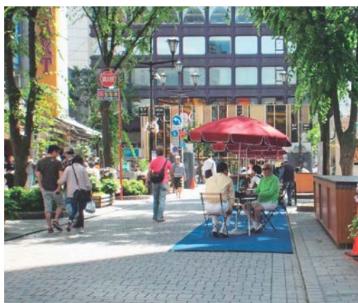
写真-1 石畳舗装とオープンカフェ

この報告では、新宿区内の歩行者優先の道路整備の変遷、並びに歩行者系舗装に関する事例について紹介いたします。