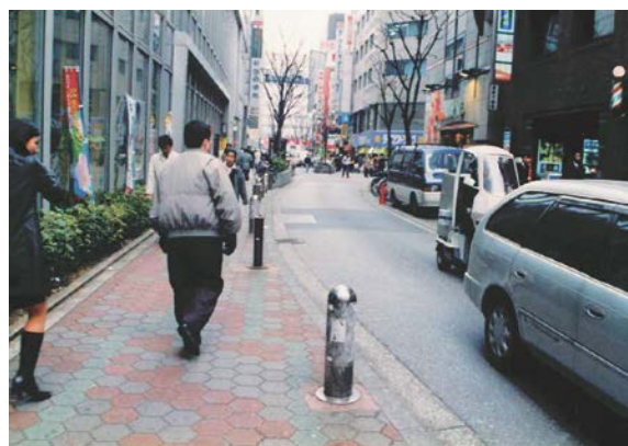
写真-8 昭和58年整備のコミュニティ道路

行者専用道路として、歩行者が安全に利用できるよう、交通規制をしています。また、夜は歓楽街になる等、時間を問わず歩行者交通量が多い地区です。一方、商品の搬出入の貨物車両も多く、荷捌き待ちの車両も多い地区です。