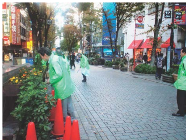
写真-5 協働による道路環境維持

このようなグレードアップ分の舗装の維持管理については、地元商店街が主体となり、経年劣化に対する保全措置がおよそ30年前から継続して実施されており、区道を沿道の住民と協働で管理していく先進的な取り組みは、現在まで継続されているところです。