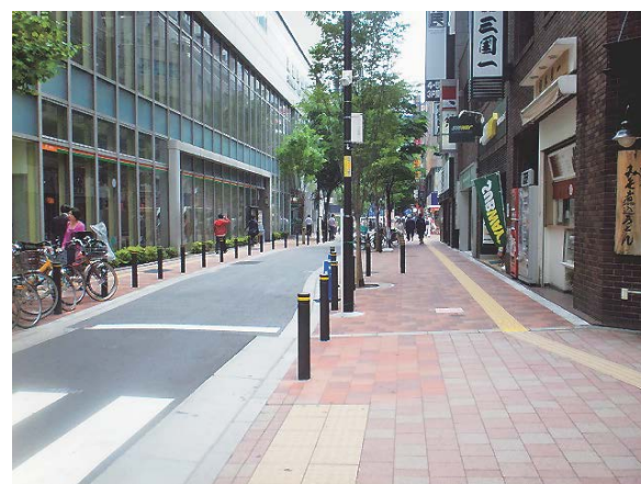
写真-9 現在のコミュニティ道路

このため、新宿区では、「人とくらしの道づくり事業」を適用することとし、幹線道路から生活道路へ流入する車を抑制し、歩行者等の安全を確保することを目的に、地域住民と一緒に街歩きを行い、歩行者等が安全で快適に利用できる道づくりを検討し、整備を進めるワークショップを、平成21年度からはじめました。