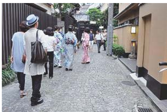
写真-4 神楽坂の石畳舗装

http://www.shinjukuku-kankou.jp/map_movie_index.html