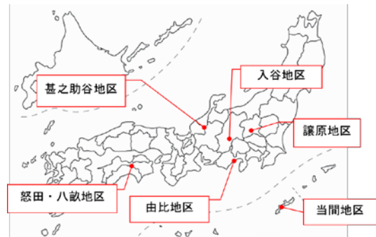
図-1 対象地すべり箇所

を整理した。本稿では、怒田・八畝地区(三津子野地区)の調査結果を例として示した(3章)。6地区の観察結果から、すべり面とその近傍で確認される特徴について整理した(4章)。それを基に、樹脂固定標本を用いた微細構造観察に基づくすべり面の認定の方法について検討した(5章)。