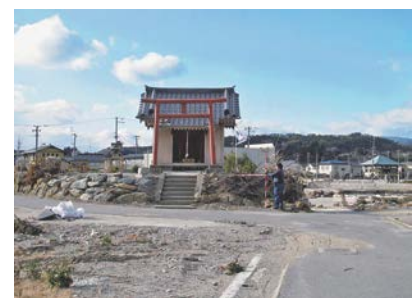
図-13 嵩上げされた地盤上に祭られた稲荷神社