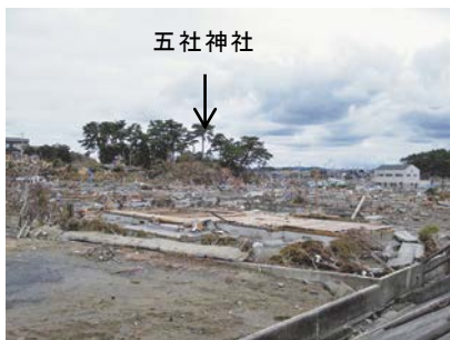
図-7 海岸堤防上から北向きに望む