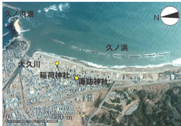
図-10 福島県久ノ浜海岸の空中写真(2012年1月撮影)

久ノ浜海岸の稲荷神社正面の海岸には1/5勾配の緩傾斜護岸が設置され、その天端の背後には旧直立護岸が後退パラペットとして残されていたが、図-11に示すように厚さ60cmの後退パラペット(旧護岸のパラペット)が津波の作用で割れて流失していた。海岸堤防から堤内地方方向を望むと、海岸近傍の家屋は土台のみを残して破壊されていたが、その奥には小規模な社(稲荷神社)が見えた(図-12)。また、堤内地盤高はこの神社を境に北向き(右側)へと低下していた。図-13は稲荷神社の拡大写真を示す。神社は石積みされた上に造られており、周辺地盤上1.2mに建てられていた。図-12と比較すれば明らかなように、周辺の地盤上に建てられた家屋が全壊していたのに対し、神社は大きく壊れることなく残されていた。ただし神社の側面では壁が壊れていたことから、神社自体が流出することはなかったものの、津波は少