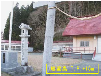
図-3 魚賀波間神社の境内と地盤高 (T.P.+15m: 地形図参照)