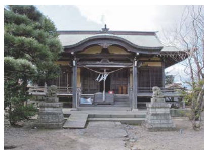
図-15 諏訪神社の社殿