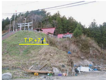
図-4 神社のある高台の中腹で観察された津波痕跡 (T.P.+7.4m)