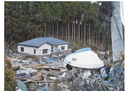
図-5 神社への参道から見下ろした被災家屋