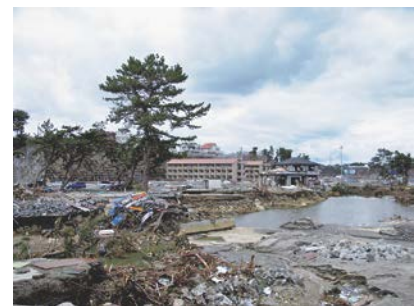
図-9 破堤時に形成された大きな池

社はこの丘の頂上に祭られていた。図-8は神社を示すが、周辺地盤上には津波による漂着物が散乱していたことから、ほぼ神社の立つ地盤高まで津波が襲来したことが分かった。漂着物のある地点の標高はT.P.+9.4mであった。一方、当地の南西