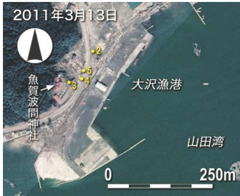
図-1 大沢地区の空撮画像(2011年3月13日)