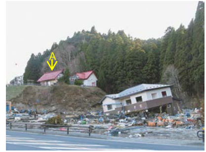
図-2 国道45号線から望む魚賀波間神社