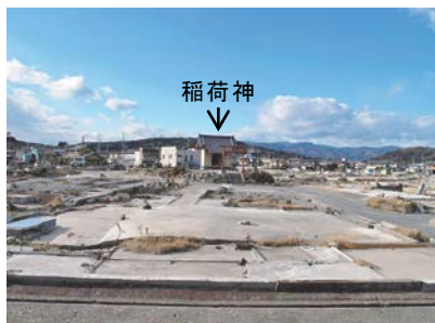
図-12 海岸から稲荷神社を望む