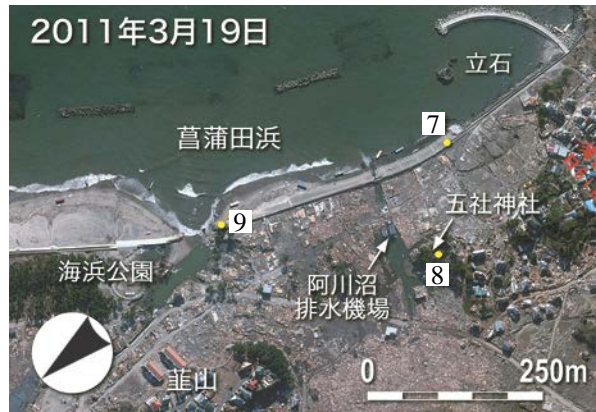
図-6 菖蒲田浜の空撮画像 (2011年3月19日)