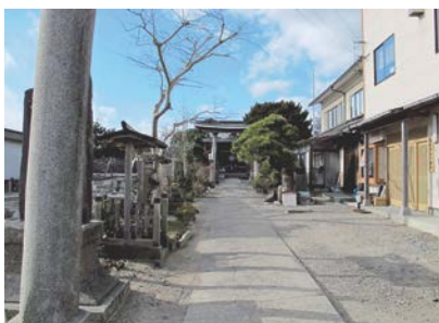
図-14 諏訪神社の参道とその奥に祭られた社殿