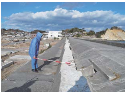
図-11 破壊されたパラペット