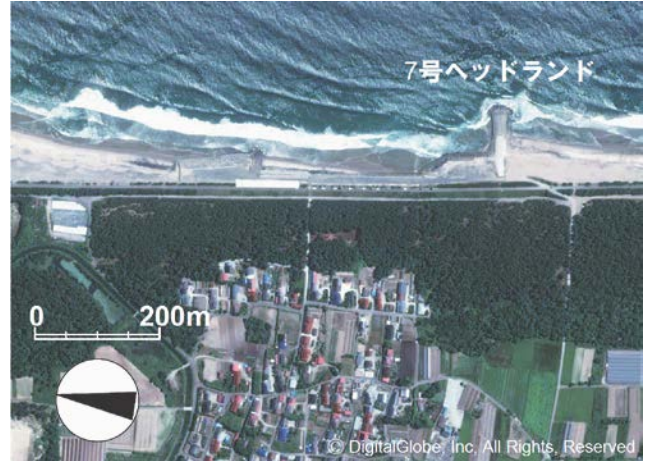
図-1 宮城県山元海岸の調査区域 (2010年8月撮影)

2011年3月11日午後2時46分、宮城県の牡鹿半島の東南東130km沖を震源地とするマグニチュード9.0の大地震（東北地方太平洋沖地震）が発生し、この地震に伴い三陸沿岸や仙台湾沿岸に大津波が襲来した。この大津波により、仙台湾沿岸各地では海岸堤防の陸側に幅約30mの溝が形成されるとともに多くの地点で破堤が起こり、さらに陸域に侵入した津波の押し波と戻り流れによって海岸線近傍に楔状の湾入部が形成された。仙台湾南部、山元海岸でもこの現象が起き、堤防背後に大きな溝ができ、のり枠式堤防の裏のりが破壊された。一方、破堤を免れた海岸堤防の多くはあたかも離岸堤のように消波効果を発揮し、それらの背後にトンボロを発生させた。大津波の作用時破堤を免れた海岸堤防の表のり面はほぼ原形を保ったのに対して、裏のり面では崩壊が進む現象は各所で観察された。ここでは、宮城県山元海岸において2011年8月12日に実施した踏査の結果を基に考察する。調査対象地は、山元海岸の7号ヘッドランド周辺であるが、津波襲来前の2010年8月と津波襲来直後の2011年3月13日、および津波襲来から26日が経過した2011年4月6日撮影の衛星画像を図-1, 2, 3に示す。なお、図-3には2011年8月12日の現地踏査時の写真撮影地点を番号で示す。