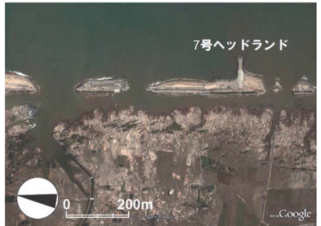
図-2 宮城県山元海岸の調査区域 (2011年3月13日撮影)