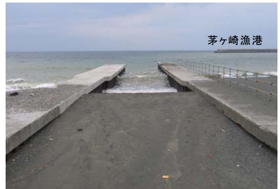
写真-2 茅ヶ崎中海岸の西端にある海水浴場との境界に伸びた6号水路の導流堤