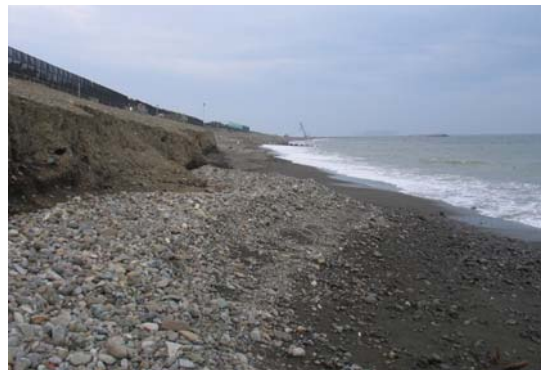
写真-6 カスプの尖り部分に集積した礫

十分あったが、上流でのダム建設などにより細砂の供給量が大きく減少した現在、飛砂によって一方的な損失が起こることは海浜全体への影響を引き起こす恐れが大きい。これらのことから、湘南海岸では毎年堆積砂を再度汀線に戻す工事が行われている 2) 。