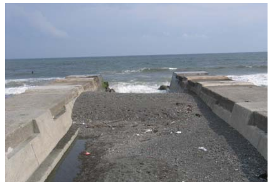
写真-1 湘南海岸の3号水路の出口にある導流堤

写真-1の場合、写真-2よりも導流堤長が短いにもかかわらず両方で砂礫の堆積状況はよく似ている。礫は汀線近傍の水深が小さい場所を主に移動しているので導流堤長は相対的に短くて済む。これと対照的に写真-2の場合には、細砂の堆積域に導流堤が伸ばされているため、長大な導流堤でも砂の堆積が著しくなる。また砂州頂より陸側斜面の勾配が写真-1の礫の場合は大きいため、上流側への砂堆積する区間長が短くて済むのに対して、写真-2のように細砂の場合には上流への入り込む長さが長くなることが分かる。