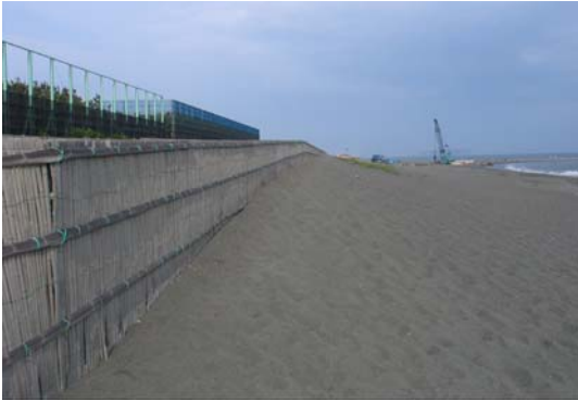
写真-3 茅ヶ崎ヘッドランドの背後地における堆砂垣前面での飛砂の堆積状況