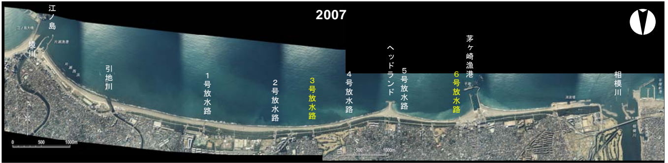
図-1 湘南海岸の空中写真 (2007年)