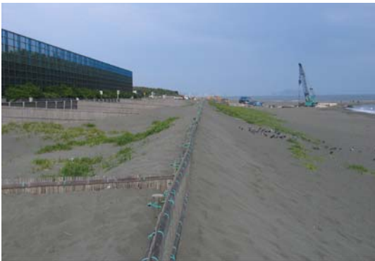
写真-4 堆砂垣を超えて裏側に大量に入り込んだ飛砂