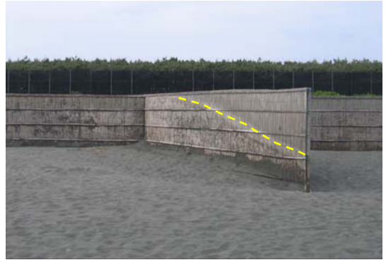
写真-5 堆砂垣の表面に残された色違い部分