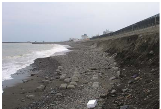
写真-7 カスプの尖り部分に集積した礫とその間に堆積している細砂

写真-3は茅ヶ崎ヘッドランドの背後地における堆砂垣前面での飛砂の堆積状況を、また写真-4は堆砂垣を超えて裏側に大量に入り込んだ飛砂の状況を示す。高さ約2mの堆砂垣が全面的に砂に埋まるまで飛砂が堆積している。こうした状態となると堆砂垣の陸側への飛砂の侵入度が増すことから、湘南海岸では堆砂垣前面の砂が除去され、汀線に戻されている。写真-5では、堆砂垣の表面に色違い部分が斜めに伸びている。白い部分が砂に埋っていた部分である。このように堆砂垣の状況を観察するだけでこの海岸では飛砂がかなり著しいこと、併せて堆積した飛砂を汀線へと戻すことの重要性が理解できよう。海岸で吹く風は人の力で制御することは不可能であり、また堆積した砂は上述のように海岸から見れば重要な資源である。したがって長期間にわたって海岸の健全性を維持する上で砂のリサイクルは毎年行う必要があるが、