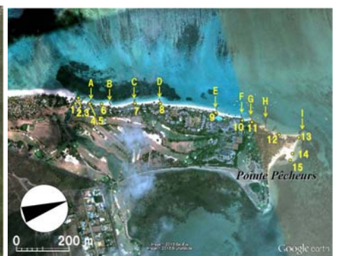
図-3 Pointe Pecheursまで伸びた海岸線および写真撮影地点