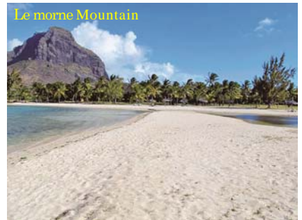
写真-15 砂州上からLe morne山を南東方向に望む浜