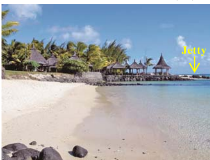
写真-4 写真-3に矢印Aで示す突堤上から南向きにjetty方面を望む