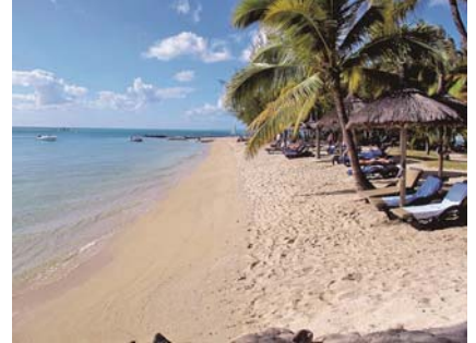
写真-12 砂嘴北端部の湾曲した汀線の中央部から広がる砂浜