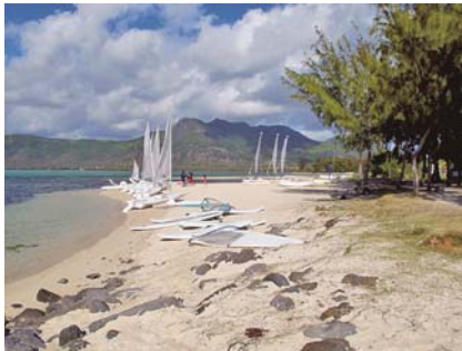
写真-13 砂嘴北端部で汀線固定のため設置された捨石