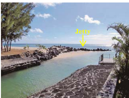
写真-1 プレジャーボートの出入り口として使われている航路と南側に伸びたjetty

次に、写真-5は突堤A上から北向きに緩く湾曲した汀線状況を示すものであり、斜め入射波条件のため突堤A北側の汀線が後退してフック状となっていた。さらに、突堤Bの南側隣接部から北向きに望むと、サンゴ礁起源の白砂が1/10程度の勾配で堆積していた（写真-6）。その後、突堤Bを通過して下手側へと移動した後、突堤Cから突堤D方面へと再び湾曲した汀線が伸びていた（写真-7）。突堤A上から北側を望んだ状況を示す写真-5と区別が付かないほどよく似た海浜状況が見られ、突堤北側の汀線が再びフック状に後退していた。このことは、一方向の卓越沿岸漂砂がある場で突堤が伸ばされて沿岸漂砂が阻止されると沿