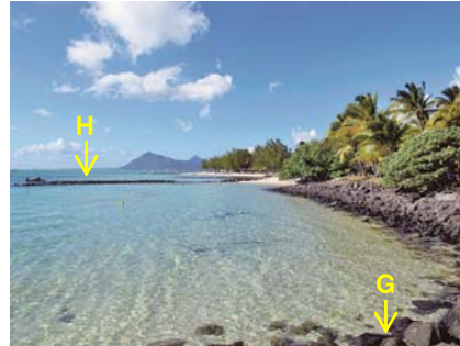
写真-11 棧橋Gの北側直近に設置された火成岩を用いた護岸