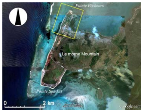
図-2 Le morne 山北側の調査区域