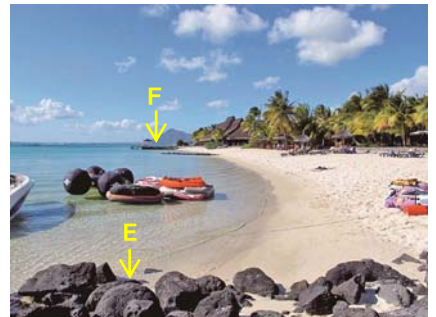
写真-9 突堤Eから北側に伸びたフック状汀線