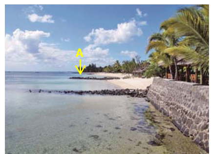
写真-3 航路の北側直近で波に曝された直立護岸