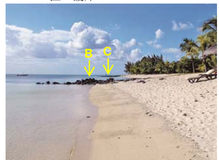
写真-6 突堤Bの南側隣接部に堆積したサンゴ礁起源の白砂