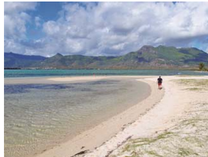
写真-14 最北端に新たに形成された小砂嘴