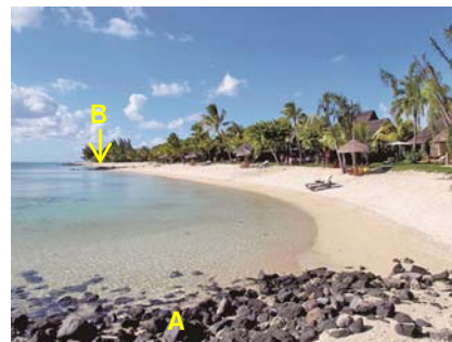
写真-5 突堤Aの付け根から北側に伸びたフック状汀線