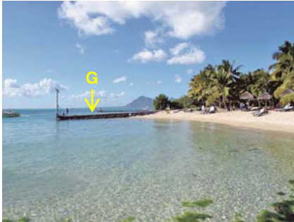
写真-10 船着き棧橋Gを南側から望む