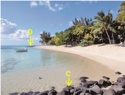
写真-7 突堤Cの付け根から突堤Dへと伸びた汀線状況