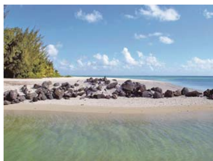
写真-2 航路に沿って伸びたjettyの南側面を北側から望む