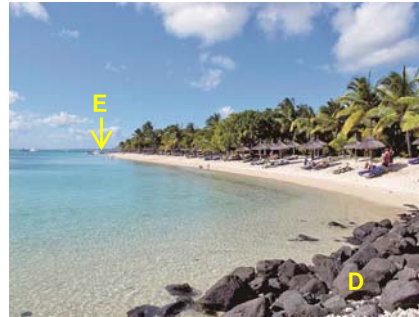
写真-8 突堤Dの付け根から突堤Eへと伸びた汀線状況