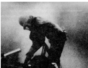
写真-1 1960年代のブラスト工事