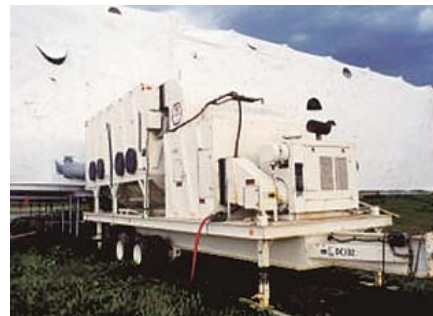
写真-5 塗装作業時に用いる大型のダストコレクター

作業時の高濃度の粉塵は視認性を損なだけでなく労働者に危険な曝露レベルとなる。このため、大型で高効率のダストコレクター(集塵機)が開発された。ダストコレクターを用いた換気によって作業環境での鉛粉塵の濃度を減少させ清掃作業を短時間で行えることになる。ダストコレクターを用いた塗装工事では、排出風が周囲環境や公共の場への影響を最小限に抑えるよう、ダストコレクターの大きさや配置場所が決められる(写真-5)。ブラストでない場合にも、覆い付きの電動工具を用いるなどで鉛粉塵の濃度を減少させている。