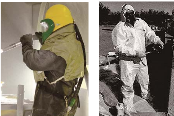
写真-3 (左)ブラスターが着用している服、(右)清掃などの作業者が着用している服