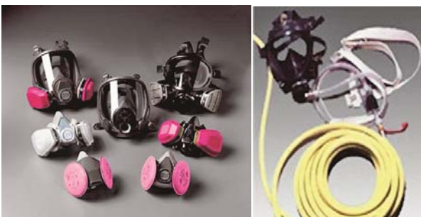
写真-4 (左)鉛作業に用いる保護マスク、(右)給気保護マスク