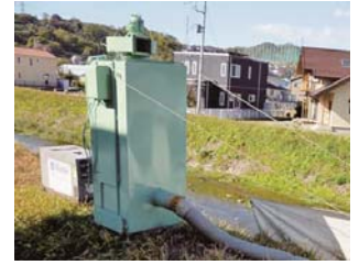
写真-7 集塵機の設置例