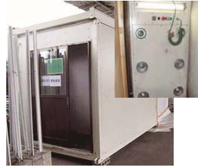
写真-6 クリーンルームと内部のエアシャワー（右上）

PCBや鉛を含む塗膜を粉塵の飛散なく安全に除去する方法として塗布系の塗膜剥離剤が使用されている。塗膜剥離剤は塗膜の剥離のみに有効であり、腐食や錆が見られたり、ジंकリッチ塗膜の付着を確保するために素地調整が必要となる場合は、ブラスト等で除去することとなる。