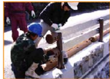
四国地方整備局型 8)