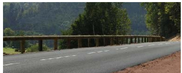
写真-3 フランスの代表的木製防護柵 4)