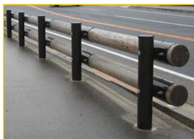
日本木材加工技術協会型