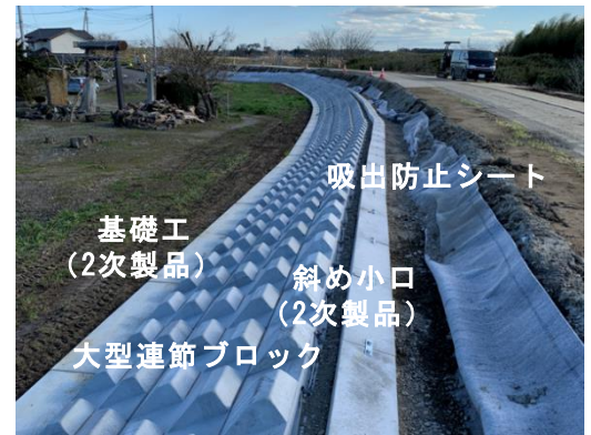
写真-5 プレキャストの基礎工、斜め小口

研究会を進めるに当たり、施工性の確保が重要である。また、コンクリートブロックやかご工に使われている石材など従来の素材と化学繊維などの新素材と組み合わせることにより機能性を高めることも重要な観点である。