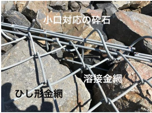
写真-2 かご工上端部の連結状況