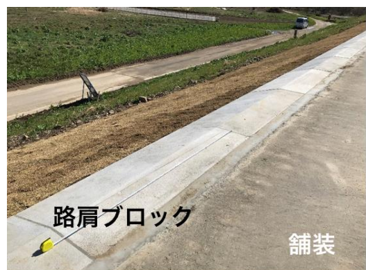
写真-6 裏のり肩のブロック設置

研究会活動に当たっては、上記のように天端、のり面、堤脚部の補強対策が複合的に効果を発揮して、堤防全体として機能を発揮することを目指す必要がある。