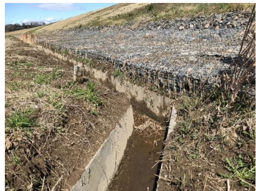
写真-1 かご工の全景

研究会活動のポイントとしては、のり先の侵食防止効果と施工性、耐久性、維持管理性などが重要な観点となると考えられる。