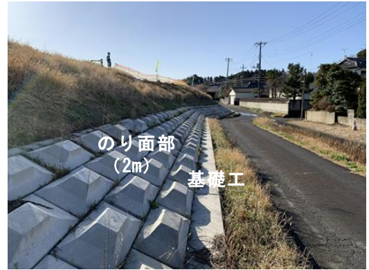
写真-4 連節ブロックにより補強 (平場なし、Bタイプ)