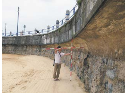
写真-5 護岸中央部のパラペット(波返し)と海側に突出した護岸上部