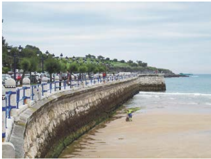
写真-12 Sardinero海岸西端の護岸