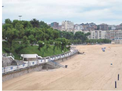
写真-10 Sardinero海岸中央の岬から西側を見下ろしつつ望む海浜とその背後の海岸護岸