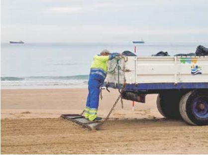
写真-9 毎朝市当局により行われるビーチクリーンの状況