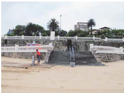
写真-7 Sardinero海岸中央部の岬の東40mにある階段とシャワー施設