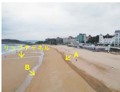
写真-2 干潮時のSardinero海岸(東向き)