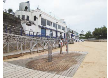
写真-6 Sardinero海岸の東端部に設置されたシャワー施設