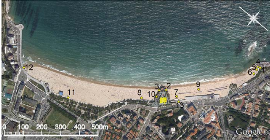
図-2 Sardinero海岸の衛星画像と写真撮影地点