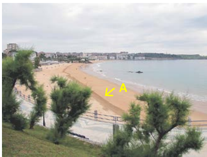
写真-1 ポケットビーチ東端から西向きにSardinero海岸を望む