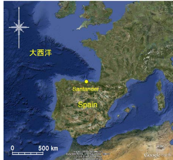
図-1 スペイン北部のSantanderの位置

Santanderは、図-1に示すようにスペインの北部に位置し、大西洋からの波浪は北西方向から入射する条件下にある。図-2は、Santanderの海側にある長さ1.3kmのポケットビーチであるSardinero海岸の衛星画像を示す。海岸中央部やや東側には小規模な岬がある。岬の突出量は小さく、沿岸漂砂はこの岬の先端を通過可能である。海浜は風化花崗岩砂（マサ土）でできている。海浜はSantanderの多くの市民の憩いの場となっており、週日であっても多くの人々が利用するきれいな海浜である。海浜幅は中央やや東にある岬の東側では100m程度、西側では中央部でとくに広く160mもの浜幅がある。またこの区域の背後は公園となっている。図-2には以下で示す写真の撮