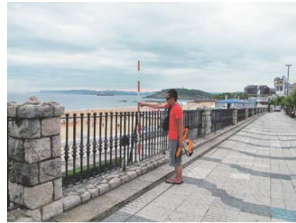
写真-13 Sardinero海岸中央の岬から50m東の岬の付け根付近の道路に沿って延びた遊歩道

海側に突出してオーバーハング状態になっていた。パラペットの位置は海浜上約1.5mであり、上部護岸の突出量は0.6mであった。護岸の基礎は石積み構造で上部はコンクリート構造であったことから、当初は下部のみ造られ、後に遊歩道の前出しが行われと推察された。