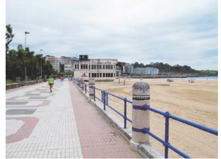
写真-11 石積み護岸上の遊歩道と柵の構造