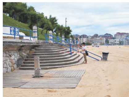
写真-8 Sardinero海岸中央部の岬の西70mにある階段とシャワー施設