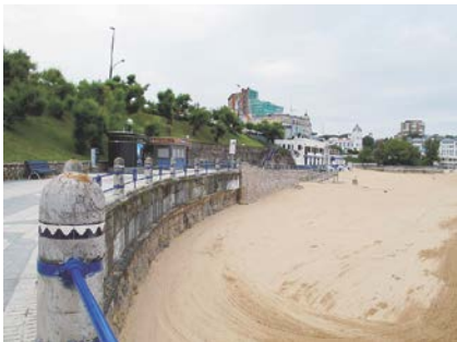
写真-4 台地下に伸びる遊歩道と砂浜