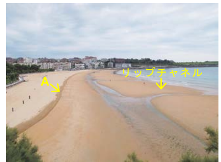
写真-3 干潮時のSardinero海岸(西向き)