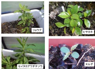
写真-1 森林表土から発芽した実生

合計種数は不明の種を除き、コナラ林が20ℓあたり、アカマツ林とアベマキ林が40ℓあたりの値を表す。