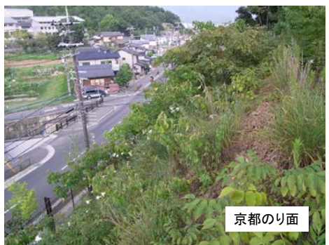
写真-2 低木群落が成立したのり面