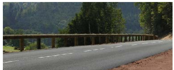
写真-3 フランスの代表的木製防護柵 4)