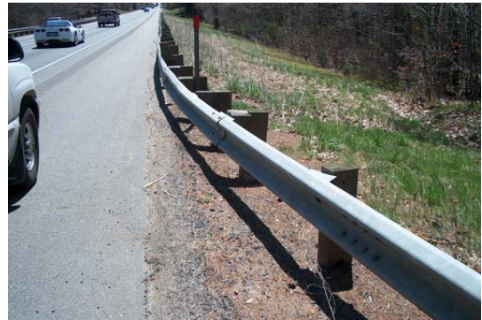
写真-1 支柱に木材を使った防護柵の例 2)

この実験に先立ち、1998年に防護柵に関する基準が改訂され、従前は防護柵材料が金属や鉄筋コンクリートに制限され寸法も規定されていた（仕様規定）ものが、実車衝突実験により性能が