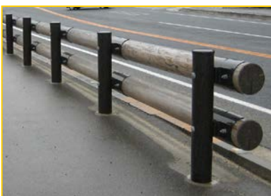
日本木材加工技術協会型