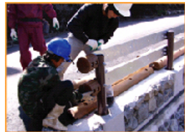
四国地方整備局型 8)