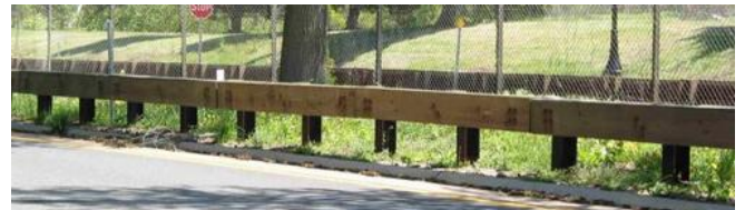
写真-2 米国の代表的木製防護柵 3)