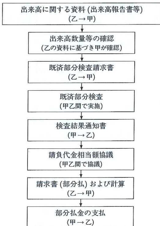
図-3 部分払に関する概略フロー

一方、斐伊川放水路長浜他堤防工事(中国)は、盛土工や掘削工が中心で、工区が7箇所にあるという特徴のある工事と言える。さらに、盛土材料の採取場所、運搬距離等が流動的であるなど、諸条件の制約があり概算発注工事として契約されたため、部分払に際しては、設計変更に伴う積算を実施し契約変更を行った上で部分払金額を決定する必要があった。このため、工区の途中段階での月毎に部分払及びその請求を行おうとすると、同じ工区で何度も繰り返し契約変更手続を行うことを余儀なくされ出来高の報告・確認も煩雑になることから、工区終了の区切りの良い段階で契約変更及び部分払が行われた。結果として、約