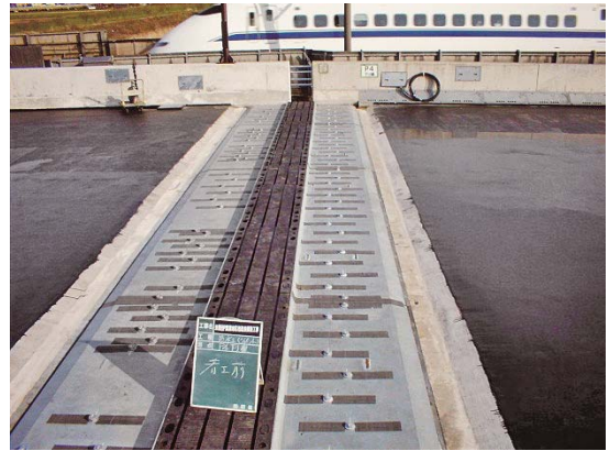
写真-4 免震橋用の伸縮装置：大変位吸収システム