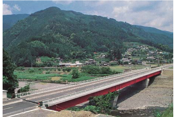
写真-1 わが国初の免震橋：宮川橋