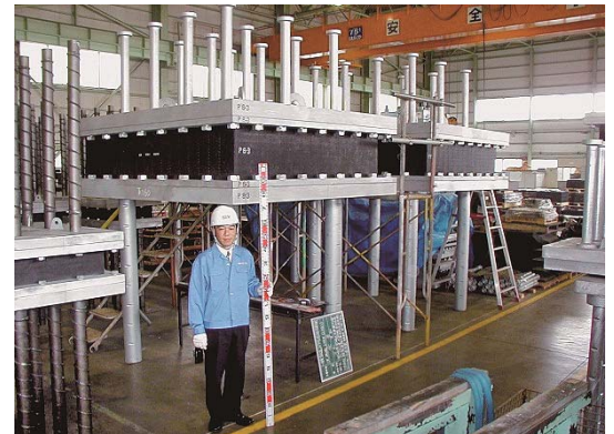
写真-5 わが国最大級の幅2m級のゴム支承