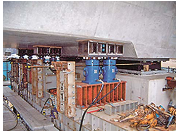
写真-3 免震支承の経年変化特性を調査するための既存支承の交換工事：山あげ大橋