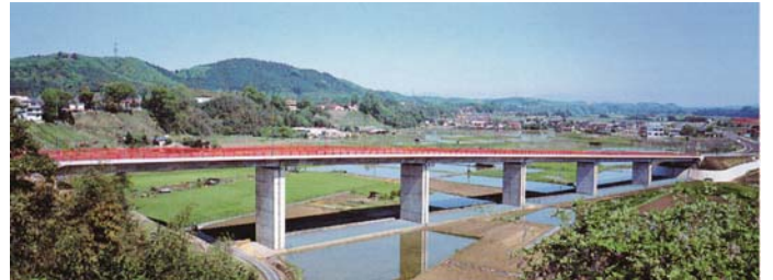
写真-2 高減衰積層ゴム支承を用いたわが国初のPC免震橋：山あげ大橋