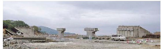
写真-1 ポステンT桁が流失した橋梁 (沼田跨線橋)

り、岩手県と宮城県沿岸部において東日本大震災の津波により被災した橋梁の現地調査を実施したので報告する。比較的大きな河川に架けられていた橋梁では、鋼桁の流失が多く見られた。また、橋台背面が連続した盛土構造となっていた橋梁では、鋼桁に比べ死荷重の大きい PC 桁の流失も見られた（写真-1）。