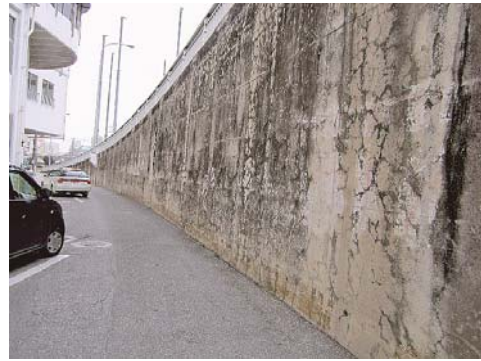
写真-4 ASRにより亀甲状のひび割れや変色が発生した橋梁取り付け道路擁壁

写真-5 は空港周辺の景観保持のため、ASRの劣化部分の上に表面被覆工を施したPC桁と下部構造を示す。水分の浸入により、ひび割れが進