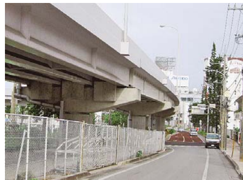
写真-5 空港周辺の景観保持のため表面被覆工を施した橋梁の上・下部構造