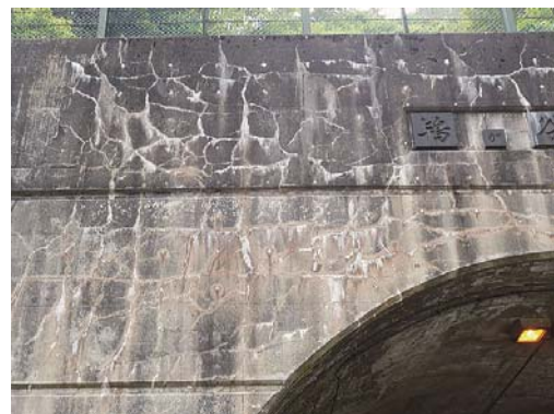
写真-6 ASRにより亀甲状のひび割れが発生したトンネル坑口

写真-6 はトンネル坑口の写真で、少鉄筋部材の場合に見られるASR特有の亀甲状ひび割れの事例である。