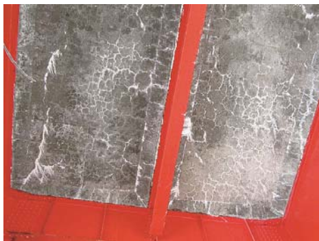
写真-8 ASRにより亀甲状のひび割れが発生したRC床版

写真-8 は鋼橋のRC床版にASRによる非常に密な亀甲状のひび割れが発生した事例を示す。このようなひび割れは、輪荷重の繰り返し作用による疲労劣化に加え、路面から供給される水分やアルカリ分（凍結防止剤に含まれる）によるASRの膨張が原因であると考えられることから、今後もひび割れの進展が予想される。