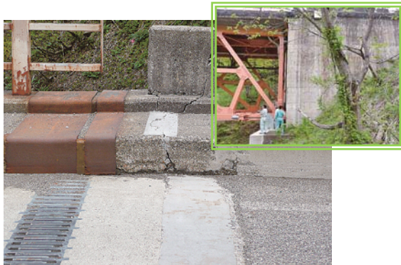
写真-7 ASRの膨張により隆起した路面

20mm ほど隆起し、伸縮装置周辺に段差が生じるとともに、取り付け道路の境界の地覆コンクリートにひび割れが発生している。