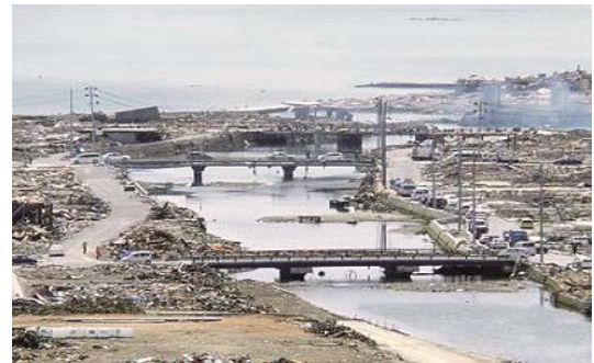
写真-2 掘割り河道に架かる小規模橋梁 (南三陸町八幡川)